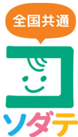
全国共通展開ロゴマーク