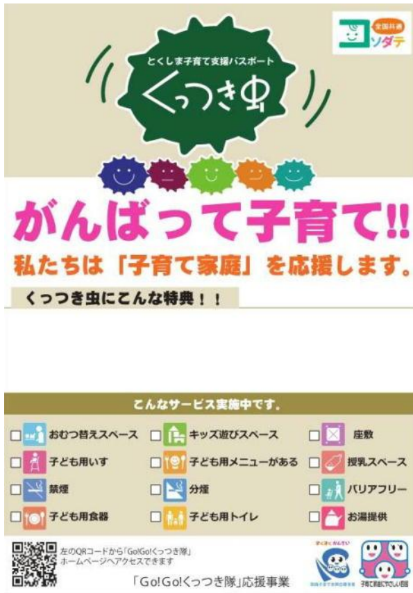
協賛ステッカー (A5サイズ)