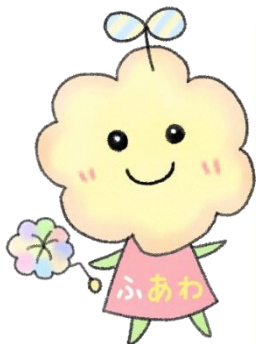
とくしま子どもの居場所づくり キャラクター「ふあわ」